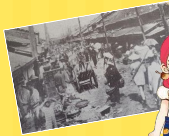
大阪府中央卸売市場キャラクター せりちゃん